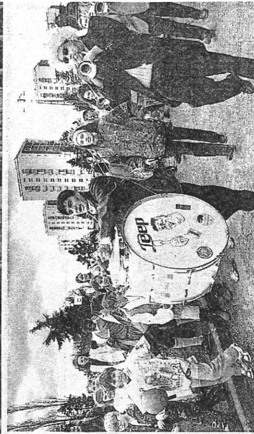
Le quartier tout entier a participé à la fête.

U N vent de folie, un vent tout court, soufflait ce jeudi après-midi sur le carnaval des Trois Cités. Un bonhomme gigantesque, tentaculaire, avec plus de 800 en-