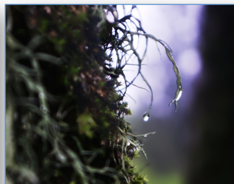
6 avril – sale temps aux 3 Cités

L'année 2012/13 a été marquée par le développement du club d'échec initié par Hadi Eshghabadi : initiation, entraînements, compétition sont au rendez-vous.