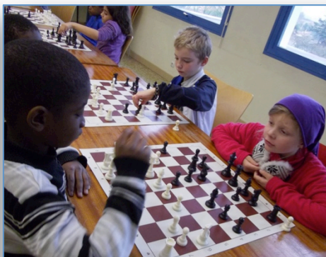
Rois et Dames des 3 Cités

Malgré une intervention administrative de la Direction Départementale de la Cohésion Sociale sur des pures questions réglementaires, l'animation de rue s'est poursuivie avec notamment des ateliers coutures intergénérationnels, mais seulement 36 jours au lieu des 38 prévus au cours de l'été 2012.