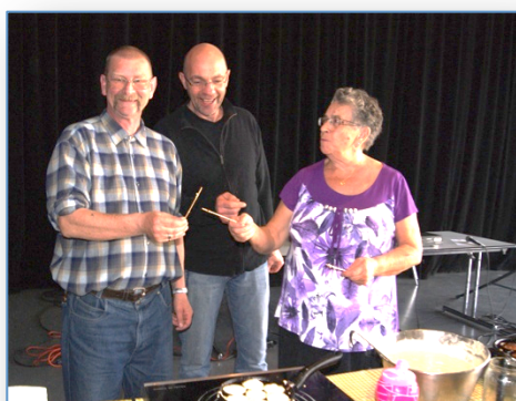
90 bénévoles actifs et engagés

Nous avons proposé à une demi-douzaine de jeunes en juin 2012, de passer un « brevet blanc ».. Cette action a été menée avec le soutien du Collège.