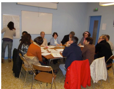
6 avril 2013 – 109 personnes

Le samedi 6 avril 2013, 109 habitants, administrateurs, bénévoles, partenaires et salariés ont travaillé sur les orientations 2013/2017 de notre association.