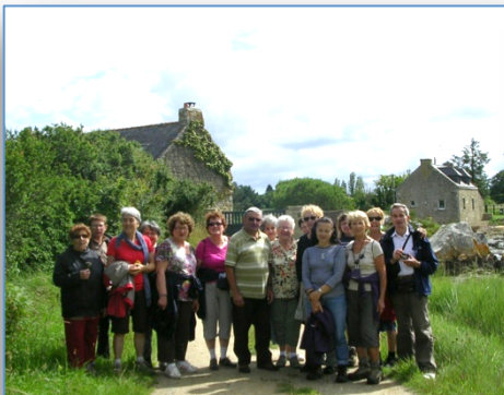
Le groupe Rando en Bretagne

Dans le cadre du Contrat de Projet, un état des lieux quantitatif et qualitatif du bénévolat au CSC a été fait par une jeune stagiaire de l'IRTS. 67% sont des femmes et 63% s'investissent au moins 2x par mois.