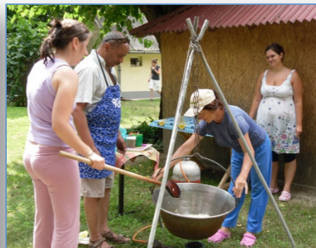
17 jeunes en Hongrie

Né d'une initiative d'habitants il y a quelques années, le groupe rando a fait pour la 1ère fois une rando de 3 jours en Bretagne en Juin 2012. Depuis quelques mois, il propose également de la rando aux enfants