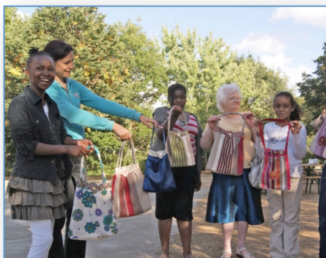
36 jours d'animation de rue

Malgré une intervention administrative de la Direction Départementale de la Cohésion Sociale sur des pures questions réglementaires, l'animation de rue s'est poursuivie avec notamment des ateliers coutures intergénérationnels, mais seulement 36 jours au lieu des 38 prévus au cours de l'été 2012.