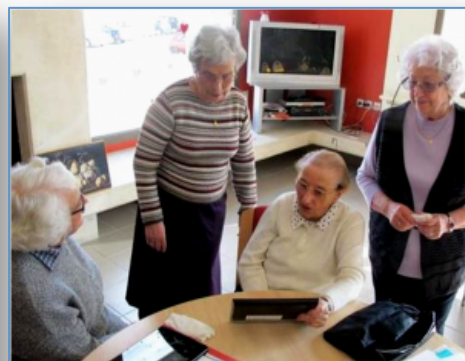
Des mamies numériques

Pour faire face au manque de places dans le cadre de l'accueil périscolaire, 6 parents se sont organisés avec l'aide du CSC et grâce au prêt d'une salle de la médiathèque pour encadrer les devoirs à tour de rôle.