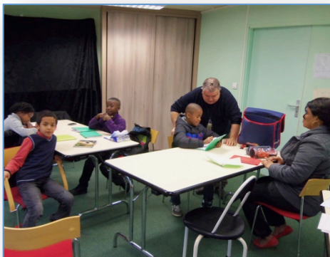
Des parents aux devoirs

Le samedi 6 avril 2013, 109 habitants, administrateurs, bénévoles, partenaires et salariés ont travaillé sur les orientations 2013/2017 de notre association.