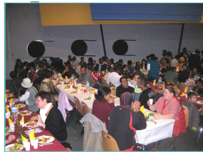
Fin des 40 ans - soirée conviviale - 4 Juillet 2008