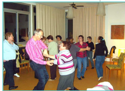
Séjour à Barcelone - Oct/Nov 2008

17 mai - Matinée Salariés / Bénévoles 31/5, 1/6 - Atelier Théâtre au Jardin des sens 1/6 - Sortie Jeunes et adultes à Oiron 7 juin 2008 - Fête de quartier 9 et 14 juin 2008 - Exposition peintures 13 juin 2008 - Soirée Cabaret 21 juin 2008 - 1, 2, 3 Cités 4/7 - Soirée conviviale Salariés / Bénévoles 4 juillet 2008 - Balade Contée du 5 au 13 juillet 2008 - Séjour en Hongrie 6/7 : Sortie familiale à la mer 8 juillet 2008 - Cinéma de plein air 14/7 : feu d'artifice de Chauvigny 26/7 - Sortie Limoges avec les personnes âgées 9 août 2008 - Sortie Port St Pierre