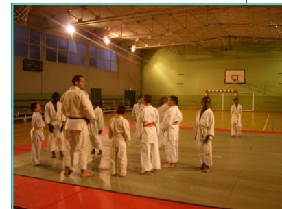
Action Judo - tous les mardis et jeudis

naires financiers de faire cette expérimentation avec les financements CLAS, ce qu'ils ont accepté. Et depuis Février la machine est lancée. Un salarié a été recruté à mi-temps avec pour unique mission, avec le soutien du reste de l'équipe, de sensibiliser, mobiliser les parents. Avec un objectif initial fixé à 12 parents, nous sommes actuellement rendus à 11 parents présents au moins une fois par semaine pour encadrer qui les devoirs, qui une activité cuisine ou encore une sortie.