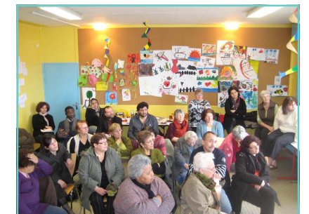
Journée salariés - bénévoles 7 février 2009