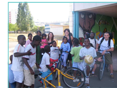
Animation de rue - été 2008