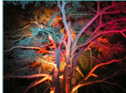
Balade Contée - 4 Juillet 2008