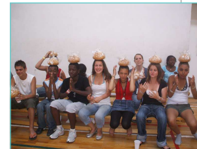
Séjour en Hongrie - juillet 2008

et en concurrence. Nous ne sommes pas touchés pour le moment mais, nous restons très vigilants à toutes les situations de concurrence directe entre associations. Cette mise en concurrence qui fragiliserait les associations serait facilitée par le prévisible remplacement des subventions par des