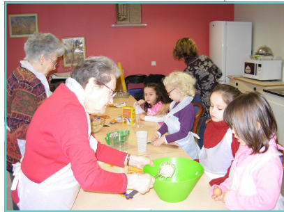
Rencontres intergénérationnelles CLM-Marie-Louise Troubat -

La dernière opération des 40 ans a été la BALADE CONTEE qui a été proposée le 4 juillet 2008 par le groupe de conteurs et conteuses des 3 Cités à partir de 21h30. Plus d'une centaine de personnes ont suivi les conteurs, soutenu par la fanfare Radio Bazar dans les rues du quartier pendant les deux heures trente qu'a duré le spectacle. La fin, magnifique, notamment grâce aux très beaux éclairages réalisés par les techniciens du Centre, s'est déroulé sous le grand cèdre.