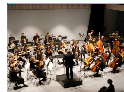
Concert de l'OPC - 24 mars 2009