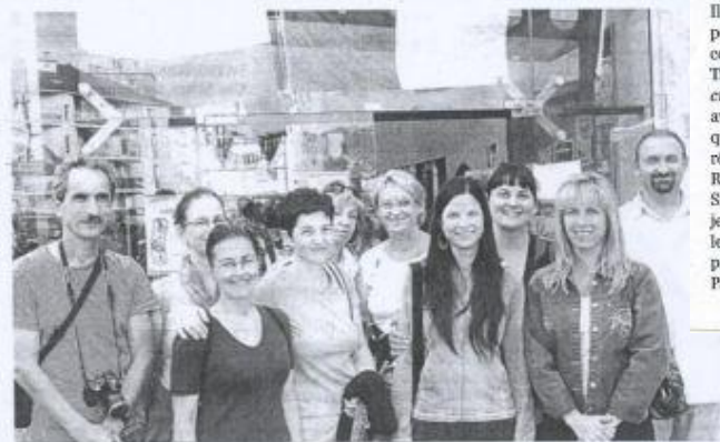
Première visite à Poitiers en reconnaissance pour les 10 adultes hongrois.

► ÉCHANGES Après avoir passé dix jours dans le quartier, les Hongrois sont rentrés chez eux.