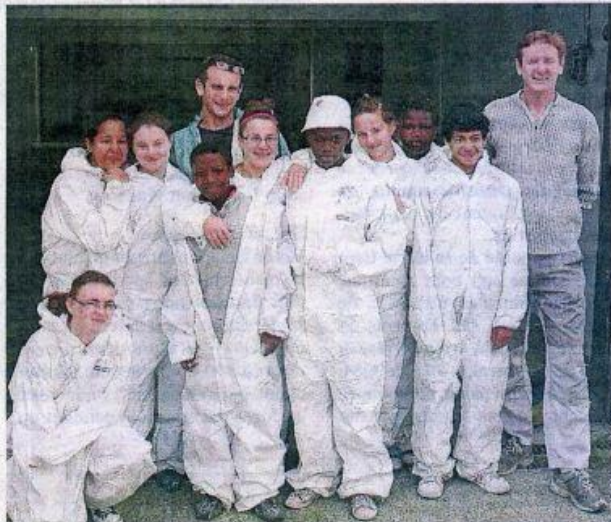
Une partie des jeunes participants du chantier loisirs et des encadrants.