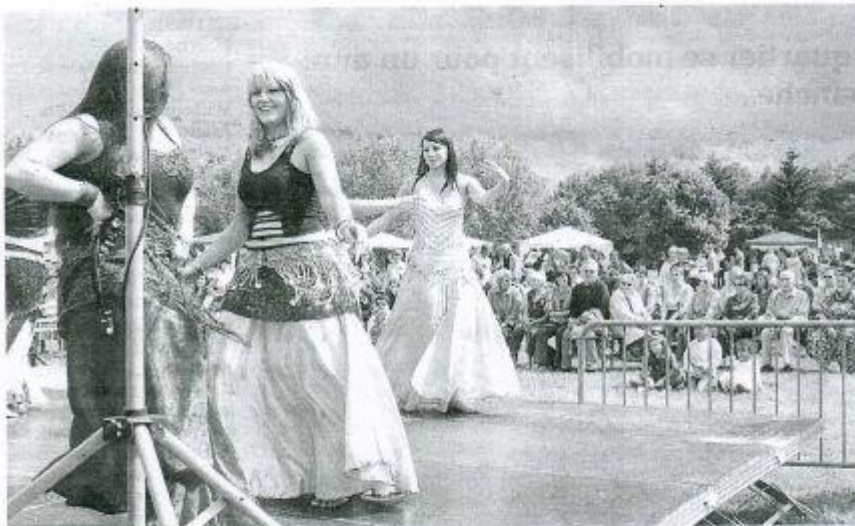
Les danseuses orientales ne redoutent pas l'orage.