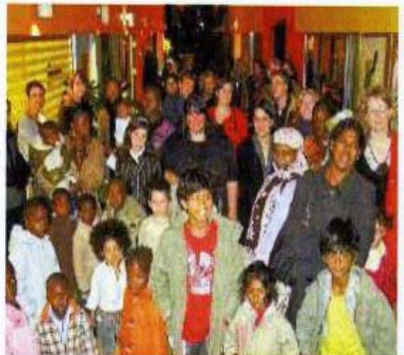
Les parents des Trois-Cités réunis au centre socioculturel pour lancer la nouvelle saison de débats.