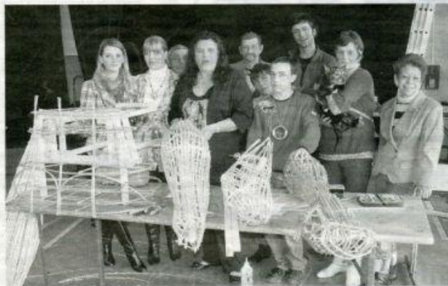
Les habitants des Trois-Cités construisent un Bonhomme Carnaval en osier.

Cette année, ce sont les bénévoles qui ont eu l'idée du Bonhomme Carnaval, à partir de laquelle Benoît a conçu les plans de cette marionnette, qui restera présentée dans son plus simple appareil d'osier blanc. Mais pas question de dévoiler ce que sera le personnage avant le grand