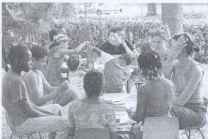
Enfants et adultes se sont bien amusés lors du repas de quartier.