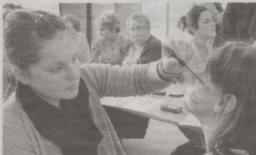
Avant le grand jour, des exercices de grimage pour les maquilleuses.