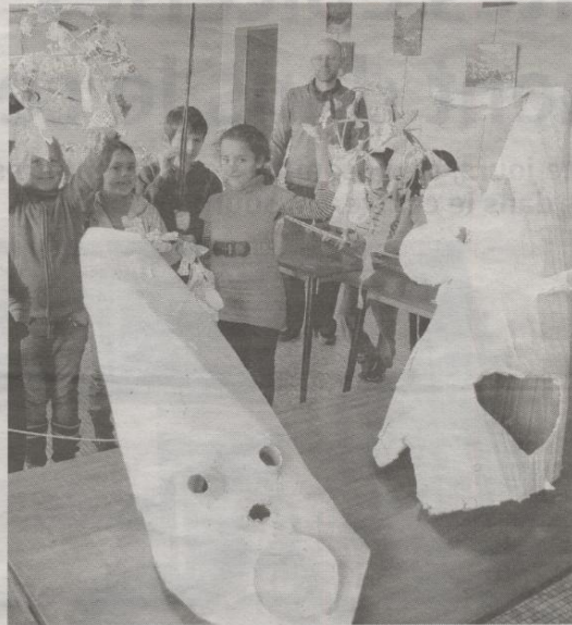
Au centre de loisirs, les enfants ont réalisé des casques-masques et des éléments de décor en osier.