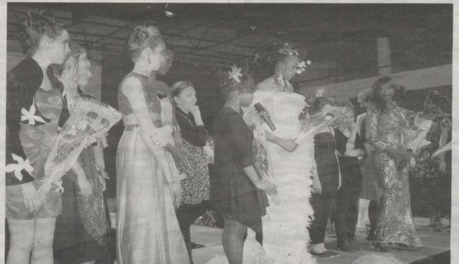
Le projet Santoba. En mars, cinq jeunes femmes du quartier présentaient leur collection afro-européenne.

Aujourd'hui, l'association des centres socioculturels des Trois-Cités enregistre 621 adhérents, soit 223 familles. Elle aide, construit et soutient une foule d'activités et de projets. On notera par exemple un travail