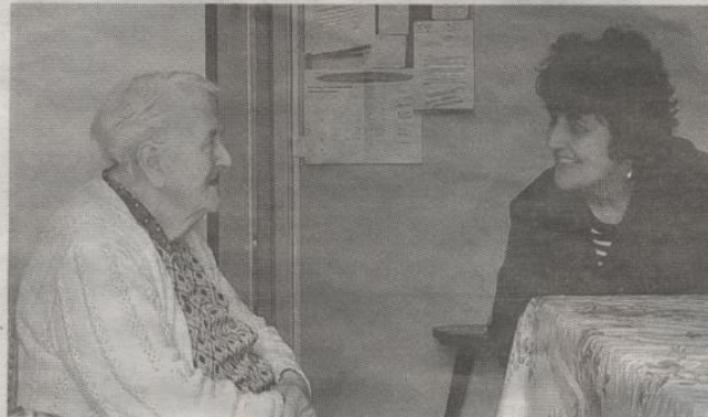
A Poitiers, dans le quartier des Trois-Cités, des bénévoles rendent visite aux retraités isolés.