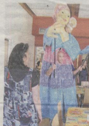
La maman esquimau, mardi dernier, dans le restaurant Les quatre épices.

> A 21 h 30 , place Moundou : mise au bûcher. La soupe à l'oignon, le chocolat chaud et les gâteaux seront offerts par Pourquoi pas ? La Ruche et le Comité de quartier.