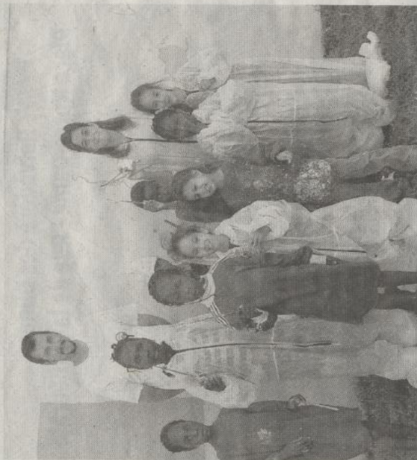
Les jeunes peintres posent devant leur œuvre en compagnie du peintre décorateur et de l'animatrice.