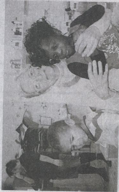
Aux Trois-Cités, le centre socioculturel favorise la rencontre entre les différents âges. Sur notre photo, au centre de loisirs maternel.