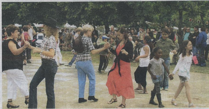
La fête du quartier, samedi dernier, au Triangle d’Or, a offert de beaux moments de rencontre entre les habitants, dans leur diversité.

« Des Poitevins en très grande difficulté ont l’impression que les étrangers sont mieux traités