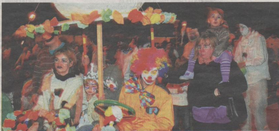
Le thème « Carte blanche » et les costumes colorés ont fait très bon ménage.

L'après-midi était presque printanière. Et si la température s'était sérieusement rafraîchie hier soir, du côté de la place de France, la chaleur a joué les prolongations avec le défilé du carnaval des Trois-Cités. Les géants de la compagnie Les Grandes personnes en tête, enfants, parents, jongleurs et musiciens ont sillonné joyeusement le quartier jusqu'à la place Moundou pour y brûler le bonhomme avant de déguster soupe à l'oignon ou chocolat chaud offert par Pourquoi pas ? La Ruche et le comité de quartier.